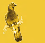
Pigeon Ramier (Palombe)